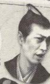
平賀源内 和田サトシ

日商連の下級武士。平賀源内と共にエレキテルの復讐などに尽力したと伝えられるが、詳しい文脈は残っていない。その後、1779年藩内と共に歿したとともその後故郷へ帰り名を全うしたとも伝えられているが現存する資料は存在しない。