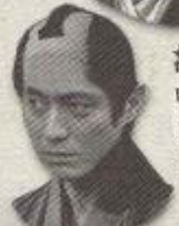
高山彦九郎 鳴海剛