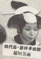
四代目・岩井半四郎 榎垣美南